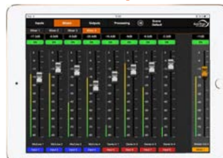
Contrôles des mixages des entrées