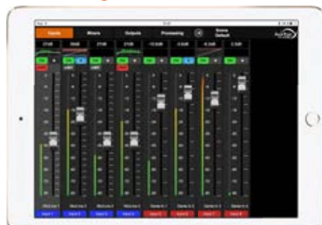
Gestion des gains d'entrées micro, Dante...